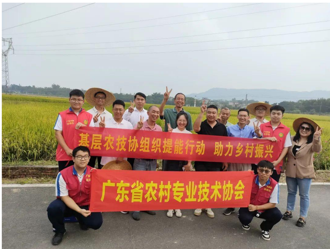
在开平儒东村开展基层农技协组织提能行动，助力乡村振兴